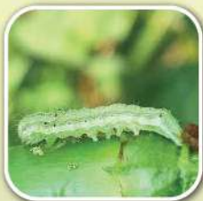
หนอนเจาะสมอฝ้าย