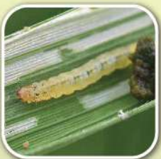
หนอนห่อใบข้าว