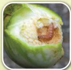
หนอนเจาะผลมะเขือ