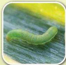
หนอนกระทู้หอม